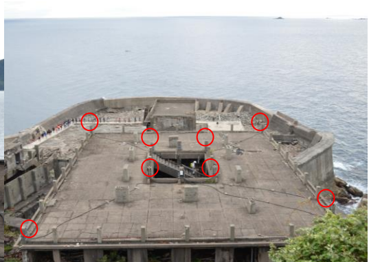
30号棟屋上とセンサ位置