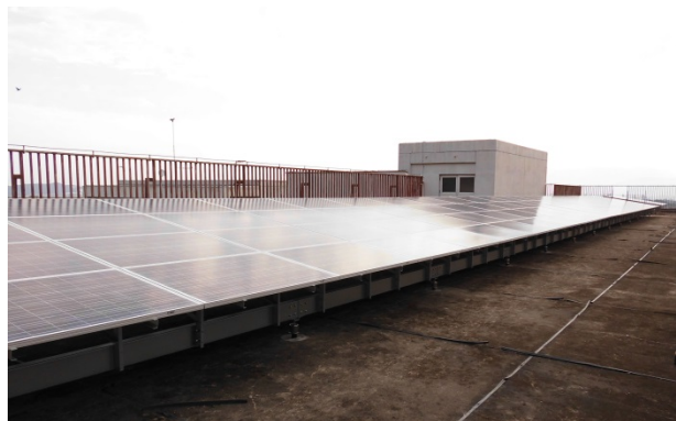
博多工業高等学校

国際L&Dは、不動産事業に環境・太陽光発電事業を組み込んだ「グリーンプロパティ」サービスの提供を通じて、安全・安心で災害に強いまちづくり、地域社会やお客様の資産価値向上と環境価値の創出に取り組んでいます。