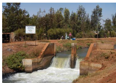
アフリカケニアプロジェクト現地写真(農業用水路)